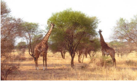
タランギーレ国立公園にて

だからマサイ族はタンザニアの北側のケニアを始めとして、タンザニア、南側のザンビアやボツワナの方にまで広く住んでいるようです。