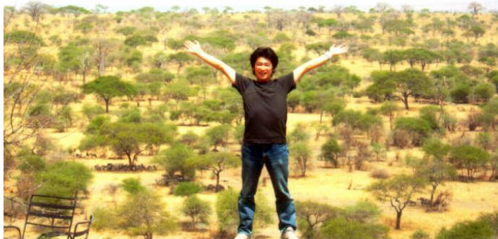
タランギーレ国立公園内、ホテルの展望台より

そんななか、マサイ族は定住地を持たず、家畜であり財産の牛の食料である草を求めて移動します。