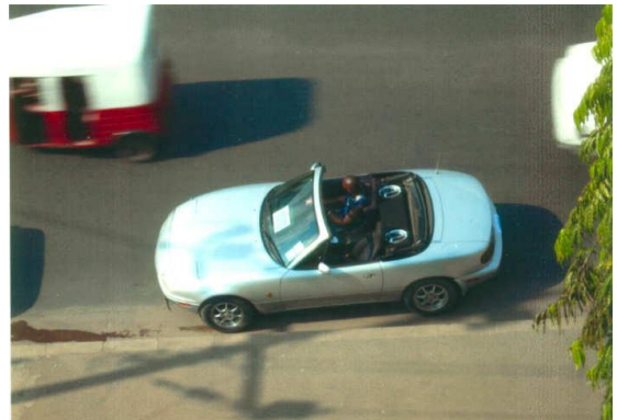
ダルエス・サラームで見つけたNA6C E

タンザニアはアフリカの中でも観光資源に恵まれた国です。先日サファリツアーでタランギーレ国立公園に行ってきましたが、野生の動物の、そのままの姿、自然の雄大さは、言葉では表現できません。もし、予算、時間が作れるのであれば、ぜひともタンザニアへお越しください。